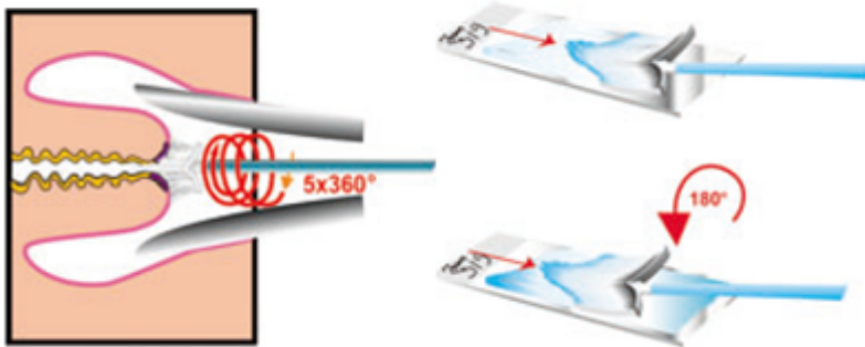
Рисунок 2. Правила забора материала для цитологического исследования цитощеткой и техника приготовления мазка.

8. Для взятия материала с эндоцервикса эндоцервикальной щеткой после введения её следует повернуть не менее трех раз против часовой стрелки (рис. 3b). Закономерно появление "кровавой росы", что свидетельствует о получении информативного цервикального образца, где, кроме слизи, присутствуют клетки практически всех слоев эпителиального пласта.